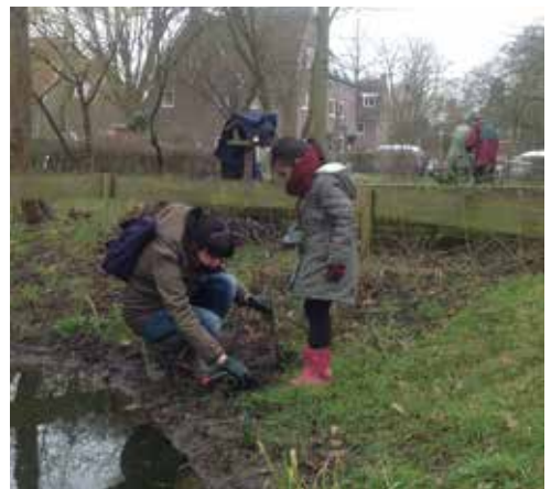
Volwassene en kind in de natuur.

De fascinatie van de geïnterviewden voor de natuur kon van alles betreffen: insecten, vogels, bossen, planten, maar ook de werking van ecosystemen. De betrokkenen benoemden een relatie tussen leren en verbondenheid met de natuur; de wens om de natuur te leren kennen, lijkt samen te gaan met de wens om zich verbonden te voelen met natuur. Of zoals uitgedrukt door een van de geïnterviewden: "Als je iets leert over de natuur, kun je dingen zien die je eerder niet zag (...) en kun je de natuur veel intenser beleven" . Een ander zegt: "Alle soorten hebben een relatie met ons en hoe meer je daarover leert hoe rijker jouw wereld wordt" .