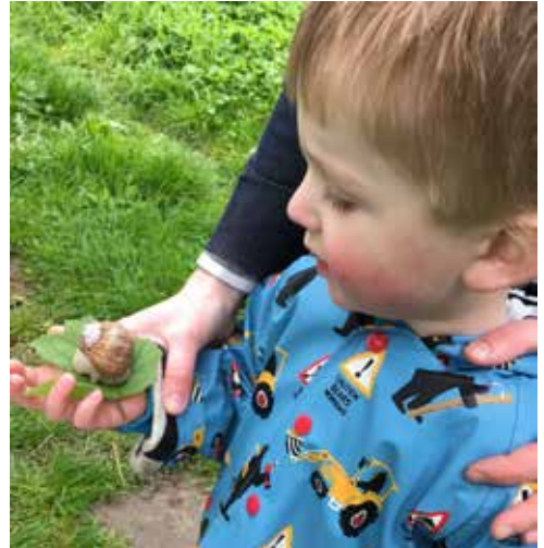
3-jarig kind met wijngaardslak.

Veel geïnterviewden hadden als kind een sterke en autonome drang naar verbondenheid met natuur, veel meer dan bijvoorbeeld hun broers en zussen. Voor velen voelt deze drang als aangeboren en verbonden met hun eerste herinneringen; ze zeggen dat zij zich als kind niet altijd bewust waren van deze verbondenheid omdat het als vanzelfsprekend voelde dat natuur er was. Vaak werd deze verbondenheid alleen maar sterker gedurende hun leven, wat samen lijkt te hangen met de wens om over die natuur te leren.